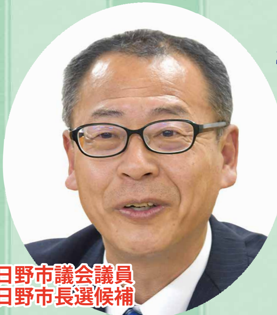
前日野市議会議員 昨年日野市長選候補